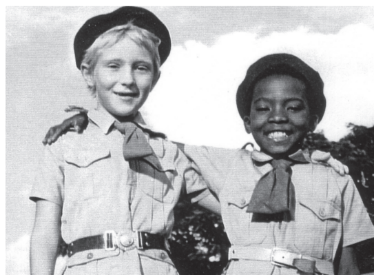
© 2006 GSB - V.U.: GSB vzw, 100 jaar Scouting, Rudy Verhoeven, Lange Kievitstraat 74, 2018 Antwerpen

De jaren '55-'60 werden gekenmerkt door een sterke numerieke expansie van de beweging in Congo en Ruanda-Burundi. De Belgische federaties zagen de noodzaak in om aandacht te besteden aan de structuur van de koloniale groeperingen, zodat de duurzaamheid werd verzekerd. De reellen van '59 in Leopoldstad luidden echter het begin in van een overdracht van de macht. Deze wordt effectief op het ogenblik van de onafhankelijkheid van Congo in 1960, de eerste stap naar de eigenlijke machts-overdracht.